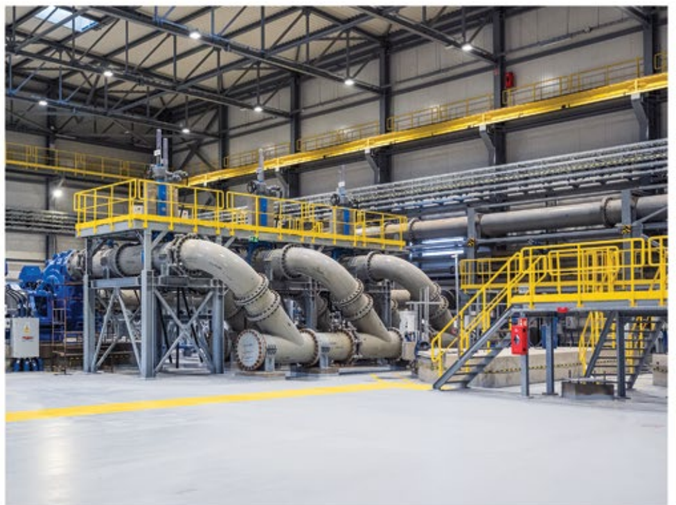
BUDOWNICTWO PRZEMYSŁOWE I INŻYNIERYJNE INDUSTRIAL BUILDINGS AND ENGINEERING STRUCTURES