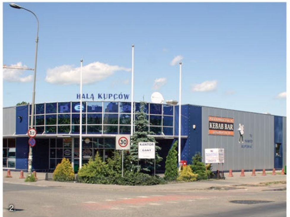
BUDOWNICTWO PRZEMYSŁOWE I INŻYNIERYJNE INDUSTRIAL BUILDINGS AND ENGINEERING STRUCTURES