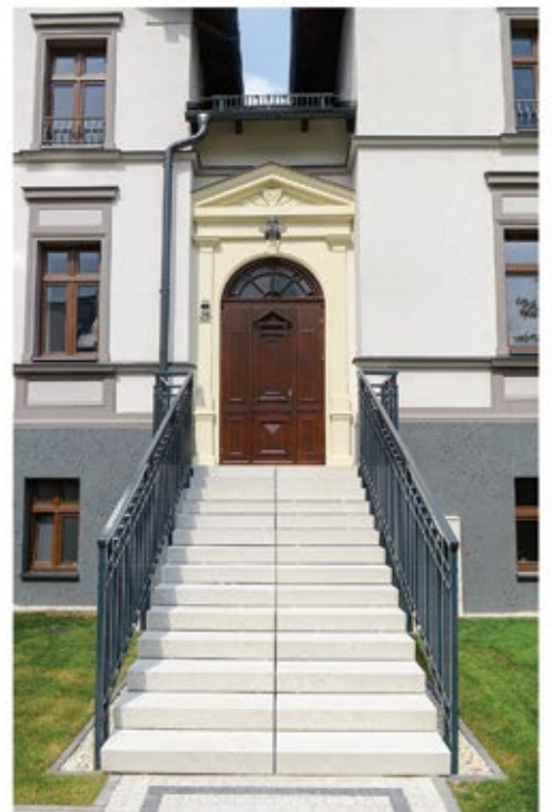
BUDOWNICTWO MIESZKANIOWE / HOUSING