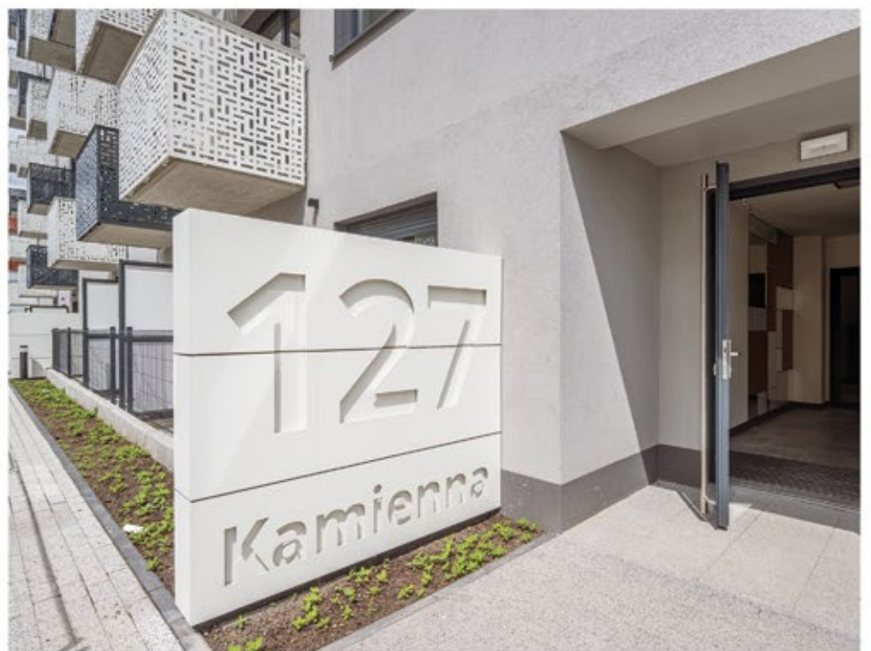
BUDOWNICTWO MIESZKANIOWE / HOUSING