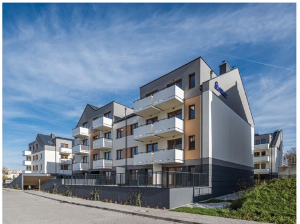
BUDOWNICTWO MIESZKANIOWE / HOUSING